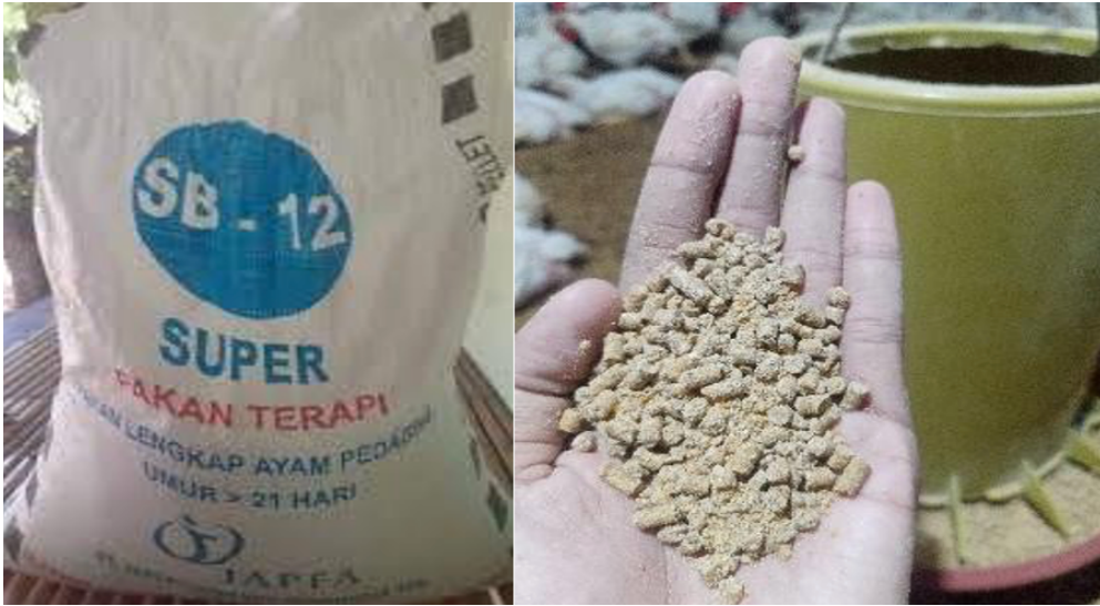
Gambar 4. Pakan Pellet (SB-12)