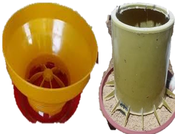
Gambar 4. Baby chick feeder (kiri), super feeder (kanan)