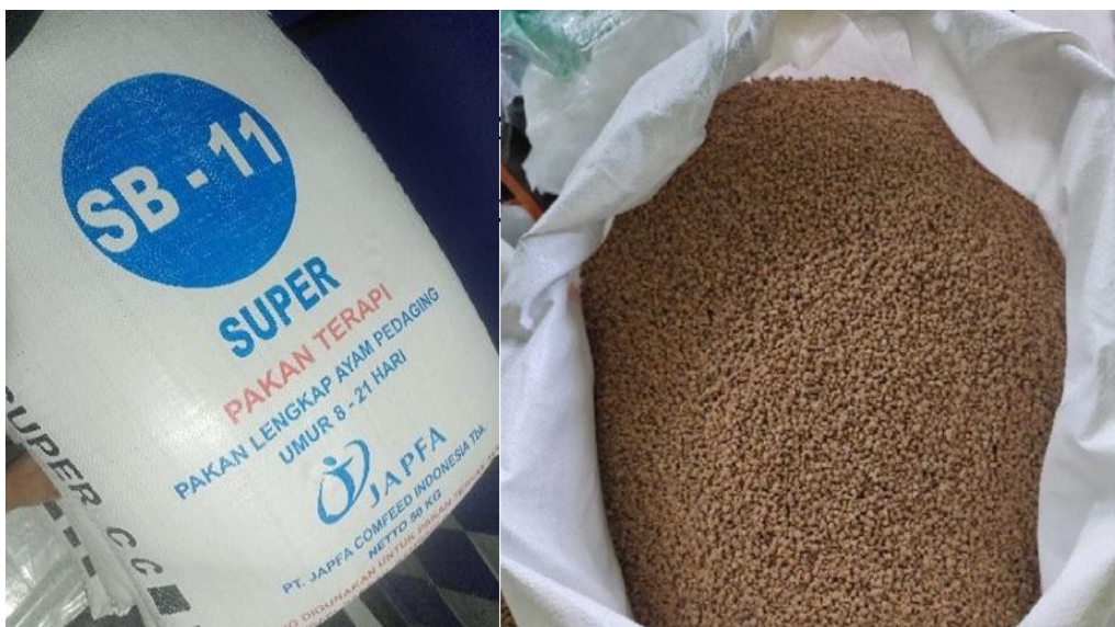
Gambar 3. Pakan Coarse Crumble (SB-11)

Tabel 4 menunjukkan bahwa kandungan nutrisi SB-10 (prestarter), SB-11 (starter), dan SB-12 (finisher) berbeda. Pakan SB-10 mengandung protein kasar lebih tinggi, yaitu 22%, SB-11 21%, dan SB-12 19%, karena kandungan protein yang berbeda-beda tergantung pada kebutuhan broiler. Hal ini sesuai dengan Alima (2017), yang menyatakan bahwa kebutuhan nutrisi pada ayam broiler dipengaruhi oleh umur. Periode starter ternak harus memperoleh perhatian khusus dalam pemberian pakan agar kebutuhan nutrisi ternak dapat terpenuhi. Kandungan nutrisi pakan pada periode starter harus lebih tinggi dibandingkan dengan fase finisher.