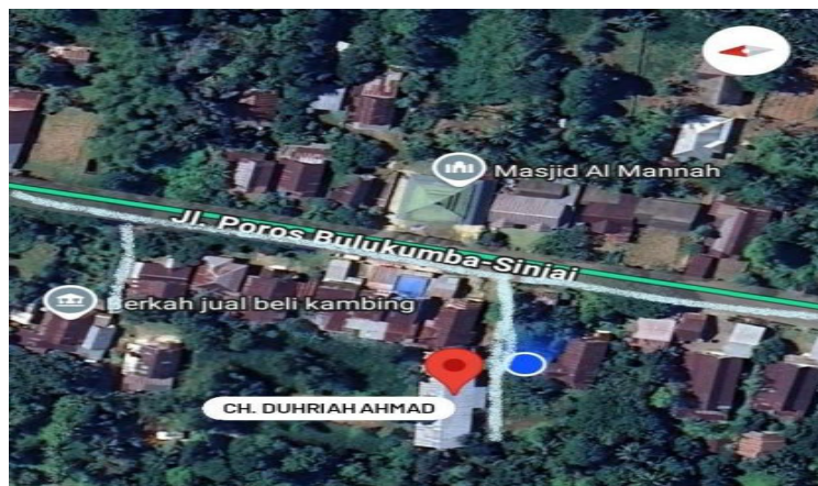
Gambar 1. Lokasi Kandang CH Durian Ahmad

Produktivitas sangat erat kaitannya dengan konsumsi dan konversi pakan. Pemberian pakan yang baik berpengaruh terhadap konsumsi, dan juga angka konversi pakan yang diberikan. Pakan yang tidak memenuhi standar nutrisi dapat menyebabkan penurunan produksi (Hasan et al., 2013). Manajemen pakan dan pemberian pakan merupakan salah satu faktor penting dalam produksi ayam pedaging. CH. Duhriah Ahmad Sinjai menggunakan metode triple feeding system dengan jenis pakan, SB-10 ( Fine Crumble ), SB-11 ( Coarse Crumble ), dan SB-12 ( Pellet ). Hal ini sesuai dengan pendapat Mulyantini (2014) yang menyatakan bahwa sistem pemberian pakan ( feeding management ) broiler yang berlaku di Indonesia adalah Triple feeding system , yaitu pemberian pakan pre-starter, starter, dan finisher selama periode pemeliharaan broiler. Pakan pre-starter diberikan pada ayam umur 1-7 hari, starter pada umur 8-21 hari, dan finisher pada umur 22 hari sampai panen (30-45 hari).