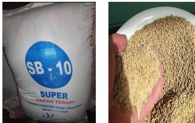
Gambar 2. Pakan Fine Crumble SB-10

Pakan SB-10 merupakan pakan komplit yang diberikan pada broiler umur 0 sampai 7 hari. Bentuk pakan SB-10, yaitu Fine Crumble , lebih halus dibandingkan SB-11 dan SB-12 (Gambar 2). Tujuan pemberian pakan SB-10 adalah karena ayam berusia 0-7 hari lebih banyak membutuhkan protein untuk pembentukan sel (hiperplasia). Hal ini sesuai dengan Bhakti (2023) yang menyatakan bahwa pada fase starter, broiler mengalami pembelahan sel yang sangat cepat sehingga memerlukan asupan protein yang lebih banyak untuk menunjang pembelahan sel tersebut. Menurut Brand (2018), ukuran butiran pakan SB-10 pellet mini berdiameter 1,6–2,4 mm dan panjang 1,5–3,0 mm sehingga memudahkan ayam mengonsumsinya karena ukurannya lebih kecil daripada pakan SB-11 dan Sb-12.