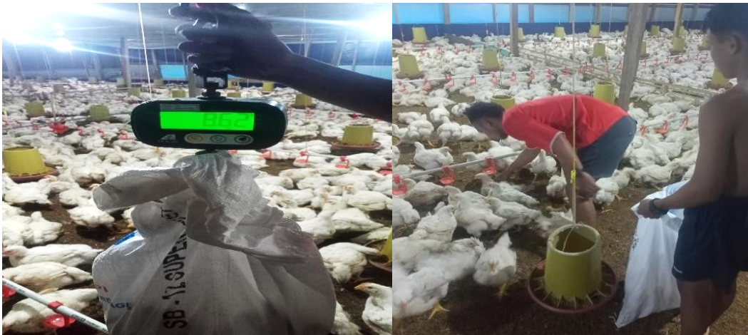
Gambar 5. Penimbangan bobot ayam

Setelah itu, sampel yang diperoleh akan dirata-ratakan. Setiap minggu pakan yang diberikan selalu meningkat dan bobot badan juga meningkat setiap minggu. sehingga hasil perhitungan berat badan pada ayam broiler di CH. Duhriah Ahmad dapat dilihat pada Tabel 4.7